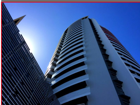
Coup de cœur